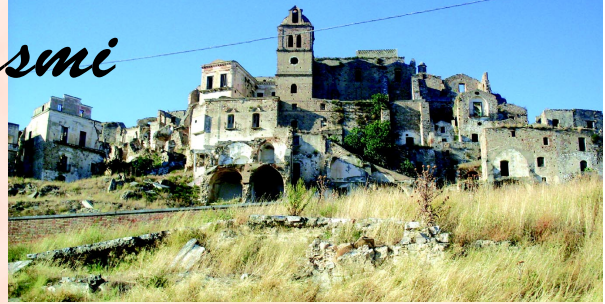
Craco (Mt) - Basilicata

Oggi sono diventati meta di un turismo alternativo e clandestino.